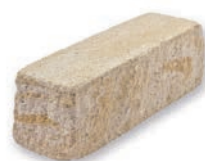
SIOLA KOMBI SAND