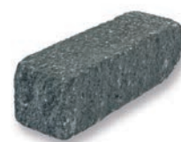
SIOLA KOMBI ANTHRAZIT