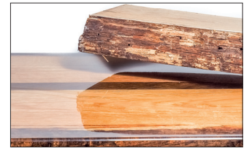
Transparente Beschichtung von Holz und anderen Materialien