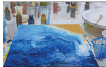
Künstlerische Anwendung und Beschichten von Bildern