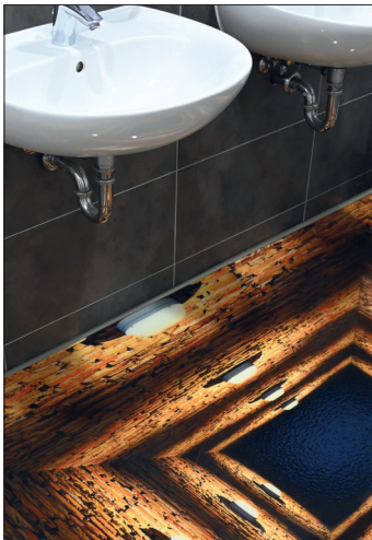
Versiegeln von 3D Design Böden und Flächen sowie Erstellung von Epoxid-Design Vergussböden

Einzigartige dekorative Kunstwerke ganz einfach selbst herstellen – z. B. River Table, Schmuckstücke, eingebettete/eingegossene Objekte und viele andere kreative Anwendungen. Zum Gießen dünner Schichten bei kleinen, transparenten Modellen, eleganten Designböden oder zur Versiegelung von 3D-Böden.