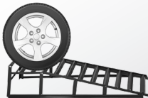
2. Position bei der Anwendung der Auffahrrampen