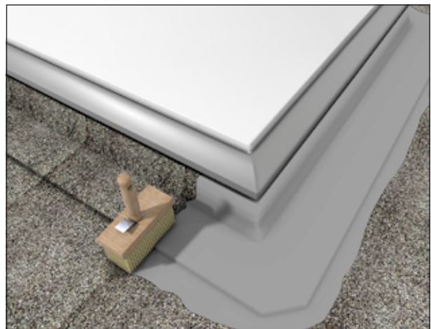
4 Abdichten von Anschlüssen und Übergängen auf Dächern.