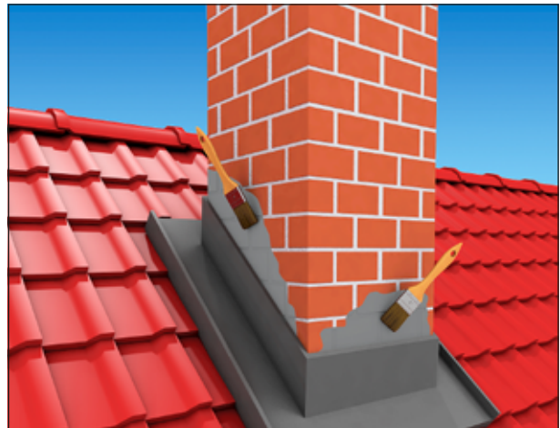
2 Abdichten von Anschlüssen an Schornsteine.