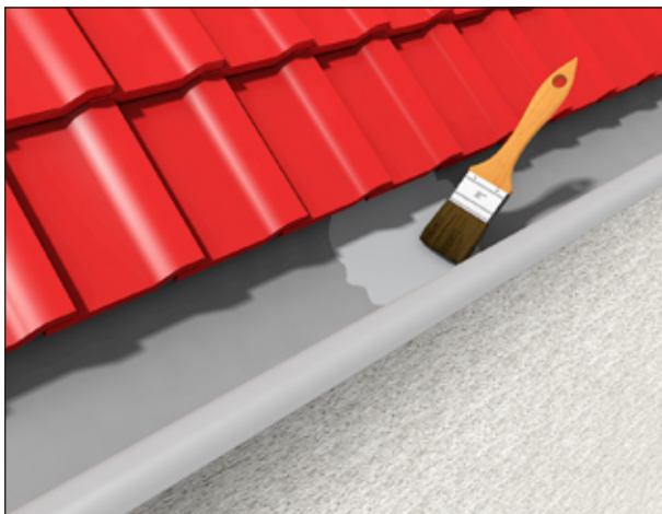
3 Abdichten und Ausbessern von Dachrinnen.