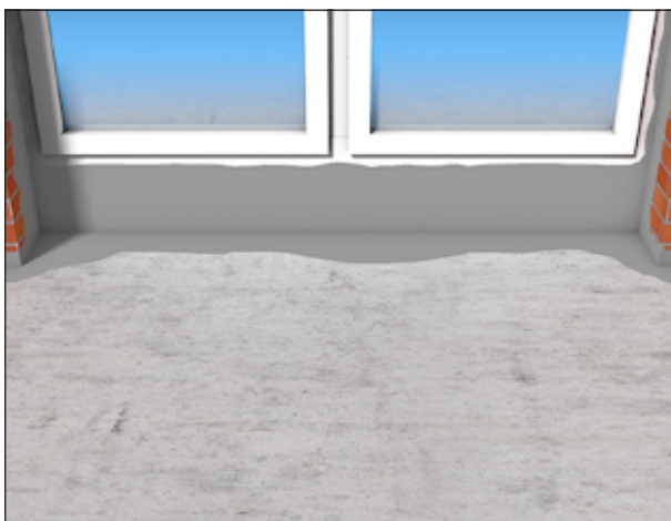
5 Andichten an Fensterrahmen.