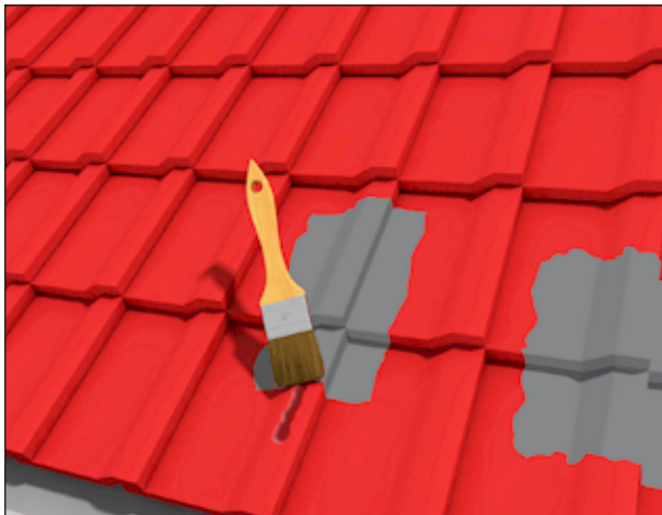
1 Abdichten und Ausbessern von Dachziegeln.