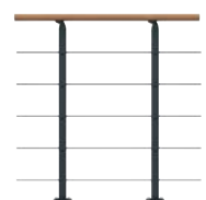
Brüstungsgeländer Erweiterungs-Paket, 1 m