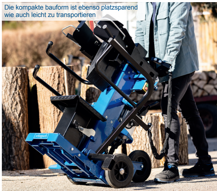
Die kompakte Bauform ist ebenso platzsparend wie auch leicht zu transportieren