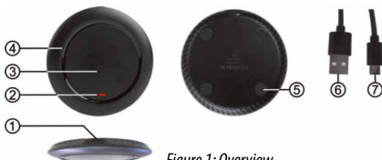
Figure 1: Overview