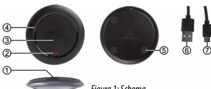
Figura 1: Schema