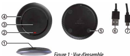
Figure 1 : Vue d'ensemble