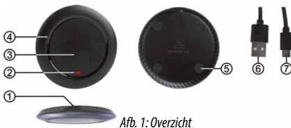
Afb. 1: Overzicht