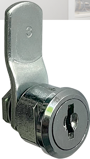
BK 92 Point