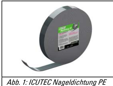
Abb. 1: ICUTEC Nageldichtung PE