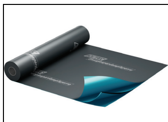
Abb. 1: ICUTEC Energiespardampfsperre

Die ICUTEC Energiespardampfsperre ist eine 3-lagige, regeneratfreie Dampfbrems- und Dampfsperrfolie, die alle Voraussetzungen für die professionelle Verarbeitung bei gedämmten Steil- und Flachdächern erfüllt. Durch die spezielle Fertigung und Kombination von Materialien wurde mit der ICUTEC Energiespardampfsperre ein Produkt entwickelt, dass dem aktuellen Stand der Technik entspricht. Die ICUTEC Energiespardampfsperre lässt nahezu keine Feuchtigkeit aus den beheizten Räumen in die Konstruktion eindringen und vermeidet damit Schimmelbildung und Feuchteschäden. Die ICUTEC Energiespardampfsperre ist energiesparend durch eine dreifach bessere Wärmereflexion gegenüber konventionellen Dampfsperren. Sie bewirkt zudem eine nachweisliche Harmonisierung elektromagnetischer Strahlung auf den menschlichen Organismus.