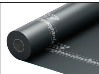
Abb. 2: ICUTEC Energiespardampfsperre